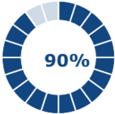
Senaste resa ANBARO